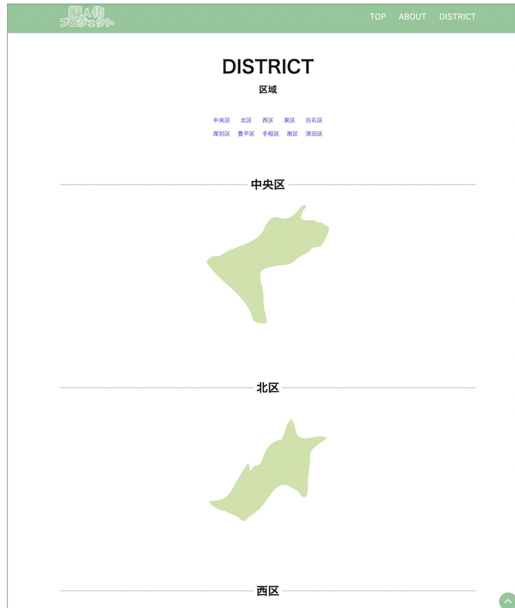
各区に移動できるページ