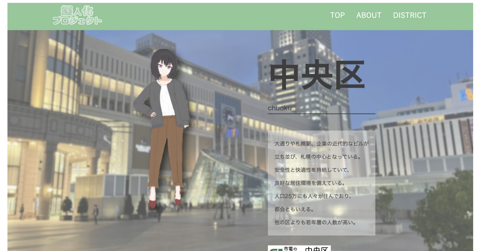
各区のページ (例: 中央区)