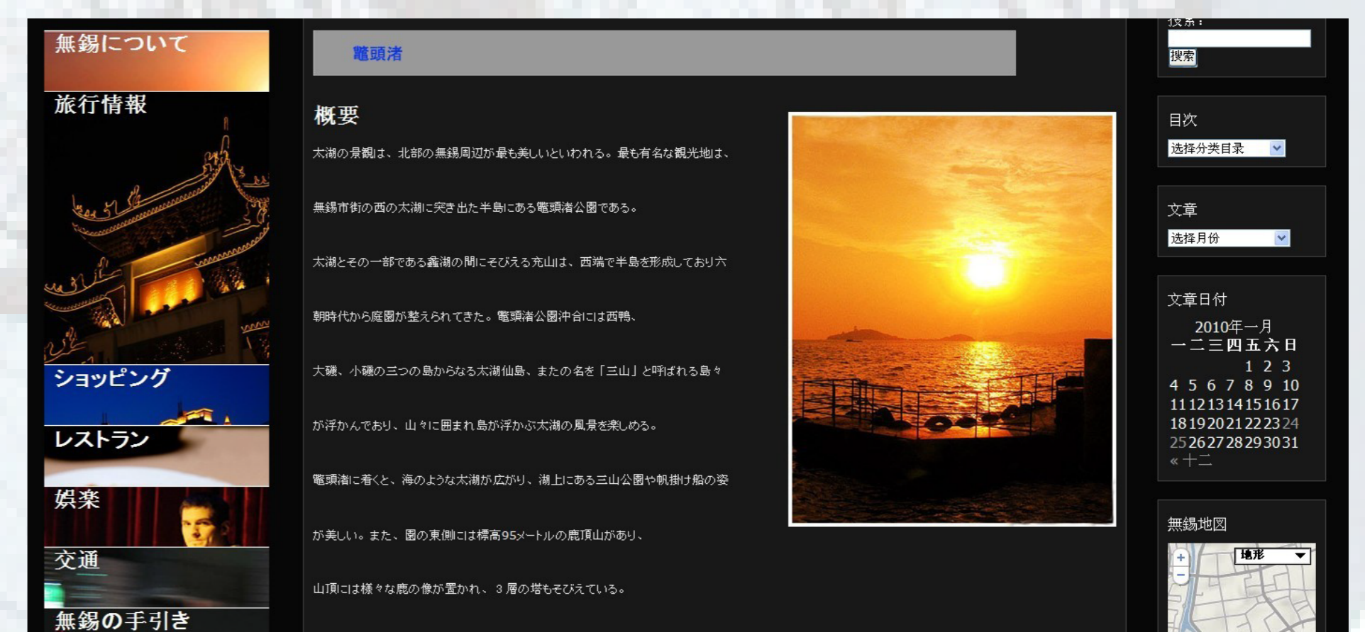
無錫の観光地の一つ紹介ページ