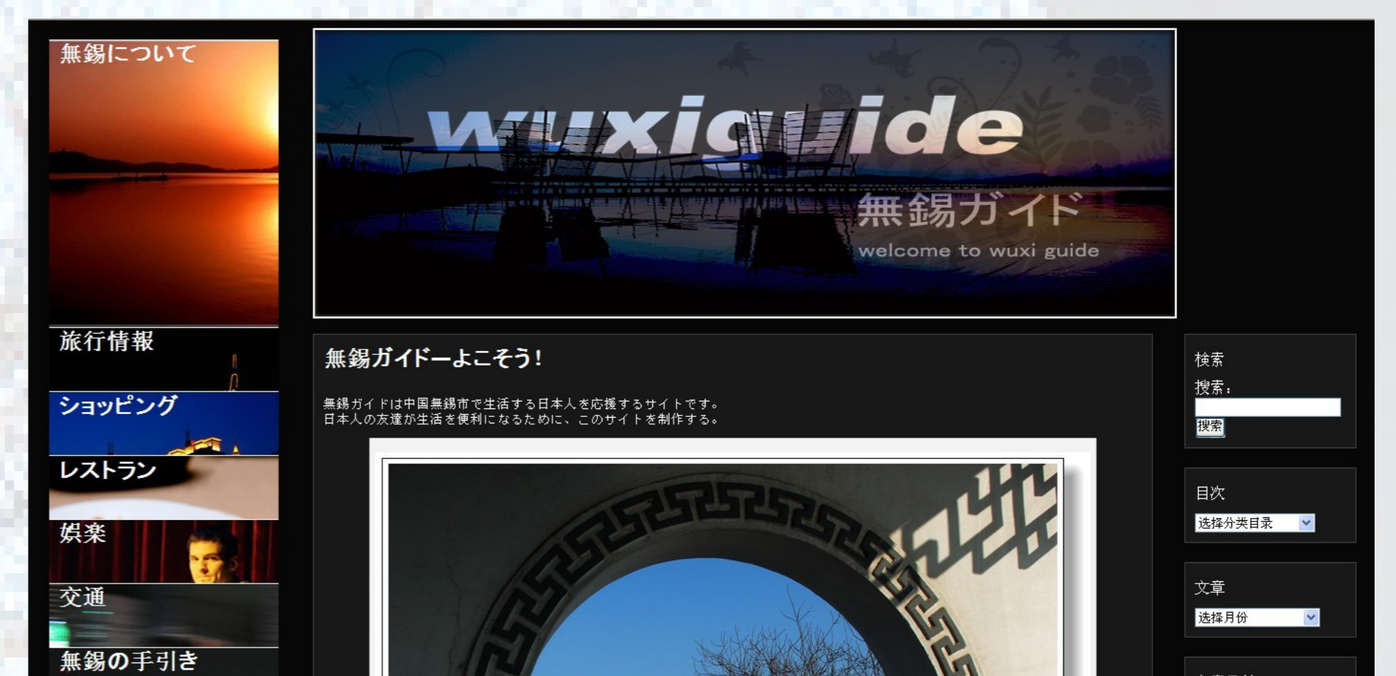
サイトのトップページ