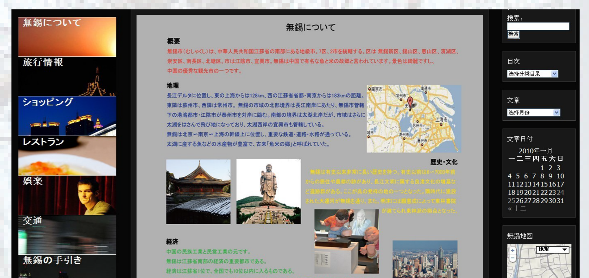
無錫についてのページ